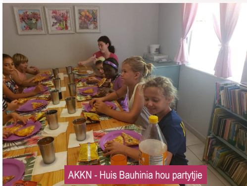
AKKN - Huis Bauhinia hou partytjie