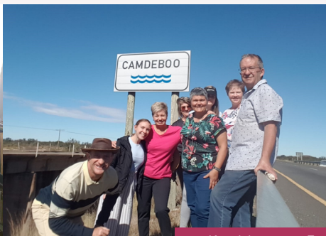
Kamdeboo stap - Fondsinsameling vir AKKN